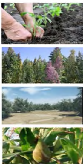
Comparación de las Siembras de Principales Cultivos (ha)

En el periodo de Agosto-Abril de la Campaña Agrícola 2016/17, el comportamiento de las siembras mostró un crecimiento de 10.8% (829 ha) en comparación a las ejecutadas en el mismo periodo de la Campaña Agrícola 2015/16, donde se instalaron 7,710 ha. Los principales cultivos que mostraron un comportamiento positivo en sus siembras fueron: Sandía (90%), zapallo (71%), aji (30%), haba (26%), maíz choclo (21%), papa (10%), olivo (8%), pimienta (4%) y tomate (3%). De otro lado, los cultivos que disminuyeron su área sembrada son: La cebolla, aji panca y quinua.